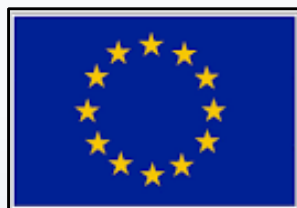
IMF Europe Founded 1999