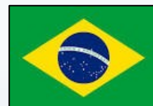
IMF Latin America Founded 2004