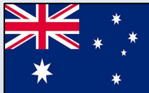
Myeloma Australia Est. 1998