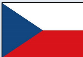
Czech Myeloma Group Est 1996