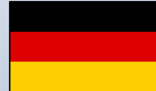
Myelom Deutschland Est. 2016