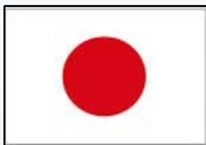
IMF Japan Founded 1997

Kromě silného zastoupení v USA IMF rozšířila svá partnerství celosvětově.