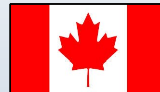
Myeloma Canada Est. 2005